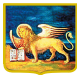
CONTRIBUTO REGIONE DEL VENETO

Si ringraziano per il patrocinio e il contributo all'evento la Regione Veneto, l'Amministrazione Comunale di Montecchio Maggiore, la ditta Armes, APAV Associazione Provinciale Apicoltori Vicenza, Banca di Pojana Maggiore e F.I.S. Fabbrica Italiana Sintetici.