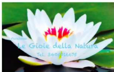
LE GIOIE DELLA NATURA Bijoux gioiello